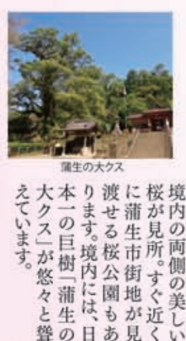
境内の両側の美しい桜が見所。すぐ近くに蒲生市街地が見渡せる桜公園もあり。境内には、日本一の巨樹「蒲生の大クス」が悠々と聳えています。