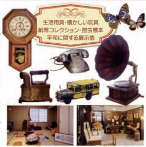
昭和の書部屋 昭和の生活用品

春は梅や鶯、夏は蝉の声、秋には柿がなり、冬は椿花。鹿児島の奥座敷「重富」に、2012年7月14日、昔の日用品や道具を集めた「重富民俗資料館」が開館しました。明治から昭和30年代を中心に、古き良き時代の暮らしを支えた生活道具など約800点。蝶・トンボ・バッタ等の昆虫コレクションも同時に展示されています。 高齢者の方々にはこれらの民具を通して時代を懐かしみ、子供たちには昆虫教室などで地域の自然に親しんでいただきたいという思いが込められています。資料館入口では、ひと昔前、街角にあった赤い円柱形の郵便ポストがお出迎え。入館料は一般200円、小中学生100円。