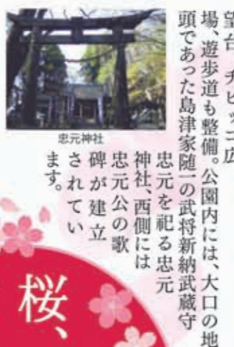
忠元神社 忠元公の歌碑が建立されています。