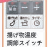
揚げ物温度調節スイッチ

余ったコーンフレークは、唐揚げやコロックなどにパン粉の代わりとして使うのもオススメです! サクサク食感はお子様にも大好評だと思います☆